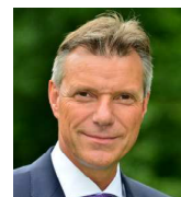
Bürgermeister Christoph Tesche