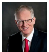
Landrat Cay Süberkrüb